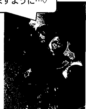
年少トマトの苗植え