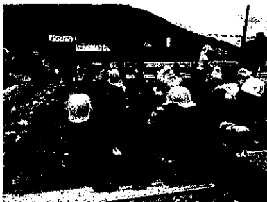
年長さつまいもの苗植え