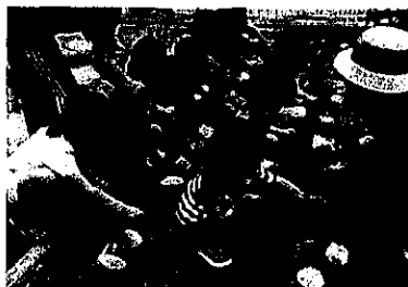
年中ポップコーンの種植え