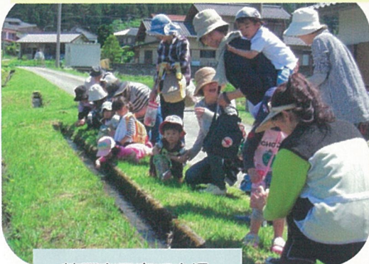
萩原南子育て広場